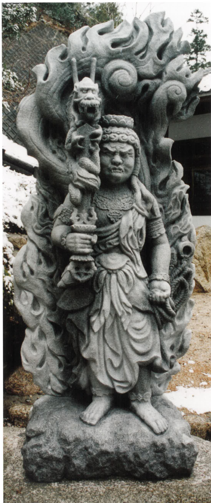
「薬王不動明王立像」(雨雪に濡れている)

愛知県産花沢小目石・火焰光背と本体が1つ石 H201.5cm×W85.7cm×D47.5cm 三重県・「湯の山温泉」内 天台宗三岳寺に建立 1999年創作