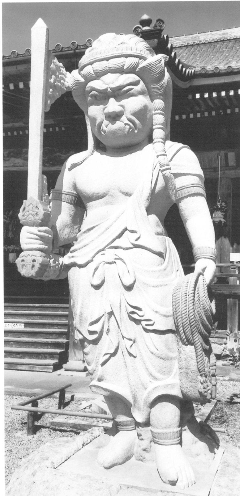
「石造・炎髪不動明王立像」 花沢石に彩色（色付）をする H212.2cm×W86.8cm×D73.5cm 京都府福地山市・観音寺に建立。 同寺は関西花の寺霊場、第一番札所