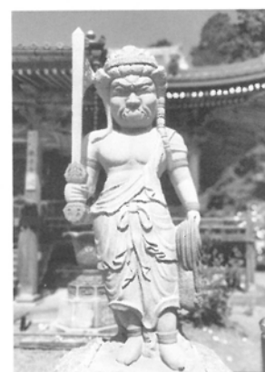
「石造・炎髪不動明王立像」 花沢石に彩色（色付）をする H212.2cm×W86.8cm×D73.5cm 京都府福地山市・観音寺に建立。 同寺は関西花の寺霊場、第一番札所