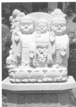
「創作・童三世仏と童三地蔵」 花沢石 H72.7cm×W59.1cm×D34.8cm 愛知県の徳川家・松平家菩提寺の大樹寺に建立。